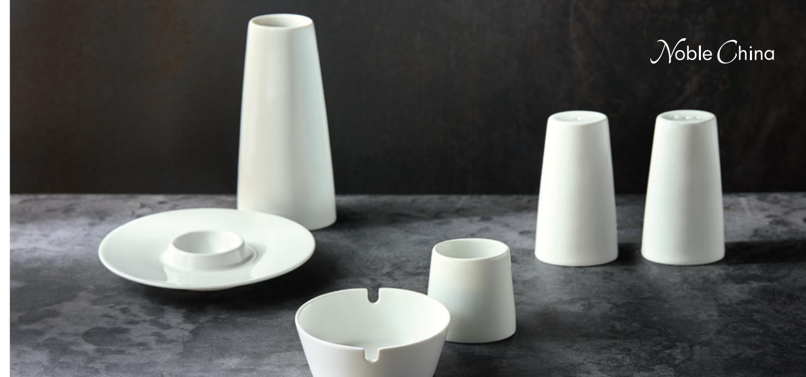
Hard porcelain white

You can find all items of the collection here bauscher.com